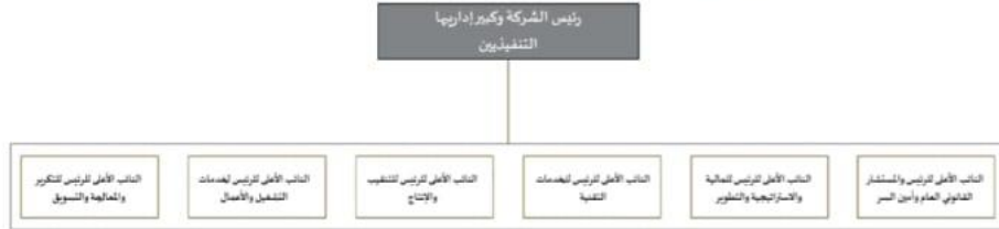
الشكل ٢٩: كبار التنفيذيين بالشركة

ويبين الجدول التالي كبار التنفيذيين كما في تاريخ هذه النشرة.